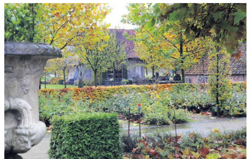
Pronkzucht: De Hallenhuisboerderij Kossink staat er het hele jaar mooi bij, de lanen in het buurtschap kleuren fraai in de herfst. Rechts de Engelse tuin Rosenhaege.