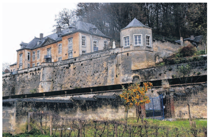
Hoog water: Grensrivier de Maas is op de route nooit ver weg. Op de rechteroever ligt de Kleine Weerd (foto midden); na het Albertkanaal volgt Château Neercanne.