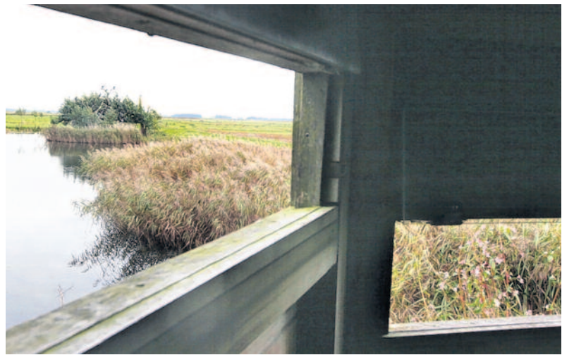
Kruip-door-sluip-door: Begin- en eindpunt van de wandeling is het informatiepaneel in Lettelbert. Onderweg veel bloeiende springbalsemien en een vogelkijkhut.