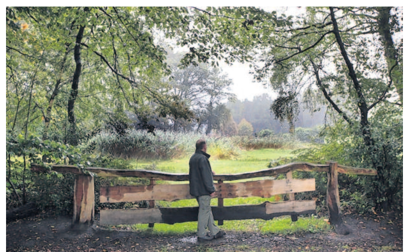
Kabelen: Bij de hofboerderij rechtsaf en je komt uit in het bos. De Eschbeek slingert door het gebied. Als de beek overstroomt, kan het water weg via een vloeuweide.