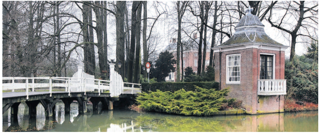
Doorkijkjes: Zoals het een voornaam slot betaamt, ligt Slot Zeist aan het eind van een lange oprijlaan. Links een stukje nieuwe natuur, De Bunsing.