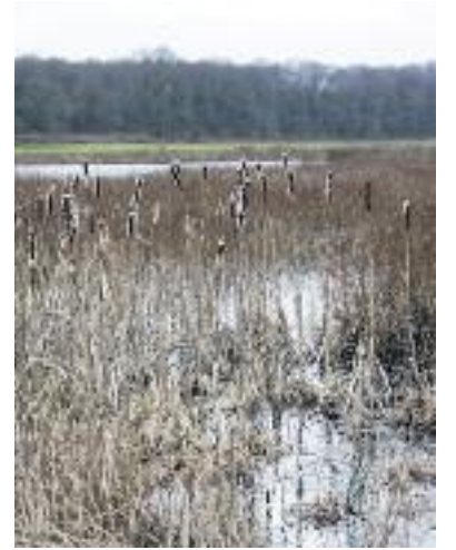
Kalend: De ruïne van kasteel Montfort en verschillende waterpoeltjes trekken de aandacht tijdens de wandeling.