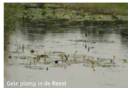
Gele plomp in de Reest