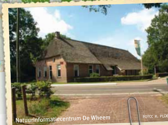
Natuurinformatiecentrum De Wheem