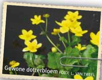
Gewone dotterbloem

De zeer zeldzame Noordse zegge komt in het Reestdal nog relatief veel voor. Deze soort is vooral te vinden in graslanden met een natte, voedselrijke bodem of in dichtgegroeide oude beekarmen, sloten en plassen. De rechtopstaande, ruwe, driekantige stengel van de Noordse zegge is tot drie millimeter dik en 30 tot 90 centimeter lang. De vlakke of iets gootvormige bladeren zijn grijsgroen. In mei en juni komt het bovenste kwart van de halm tot bloei. De vruchten zien er uit als bleekgroene, afgeplatte urntjes van twee tot drie millimeter.