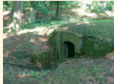
De ooftkelder is nu in gebruik als vleermuizenverblijf