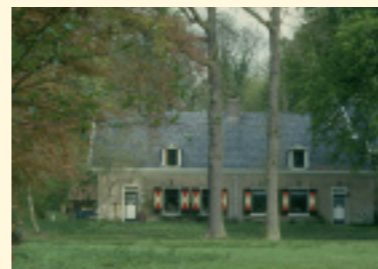
Koetshuis met de twee beuken