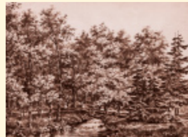
Cascade, litho uit 1840