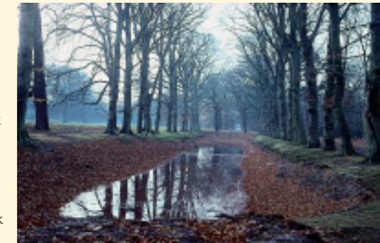
Vijver op Oud Woestduin

De brede meele laan werd in het water werd weerspiegeld om indruk te maken op het bezoek. In de tijd van de renbaan (zie 13) is de vijver in gebruik geweest als drinkplaats voor de paarden.