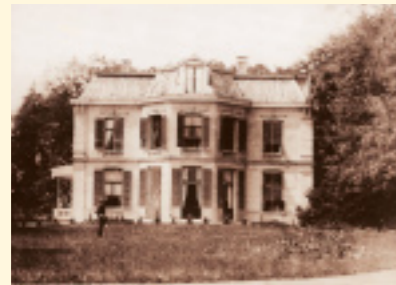
1. Het in 1920 gesloopte Huize Leyduin

2,2 km geel gemarkeerd Startpunt de Kakelye