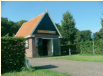
Informatiecentrum De Kakelye

Er zijn twee bewegwijzerde wandelroutes die beide starten vanaf het informatiecentrum de Kakelye, op de parkeerplaats aan de Manpadslaan. De wandelroute over landgoed Leyduin is 2,2 km en is gemarkeerd met gele stippen of palen. De wandeling over landgoed Vinkenduin en Oud Woestduin is 3,1 km en is gemarkeerd met witte stippen of palen. Tijdens de wandelingen stuit u op min of meer opvallende elementen die op het kaartje en in de tekst onder hetzelfde nummer zijn terug te vinden.